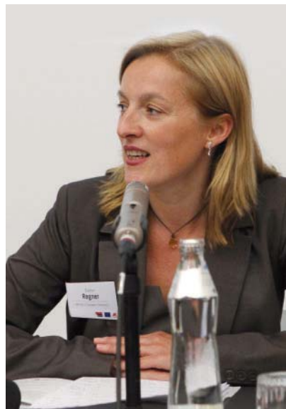
Evelyn Regner, Mitglied des Europäischen Parlaments

Während für einzelne EU-Mitgliedstaaten - so auch in Österreich - eine umfassende und teilweise auch sehr gute Datenlage zur Beschäftigungssituation vorliegt, lässt die gesamteuropäische Datenerhebung zu wünschen übrig.