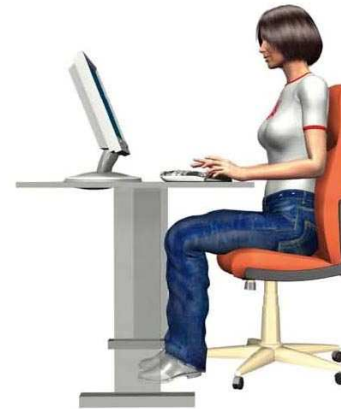
Ergonomisch richtige Sitzhaltung

Dieser Tätigkeitswechsel (z.B. kopieren, telefonieren, ...) dient der Entlastung der Augen. Der Wechsel der Körperhaltung, der in der „Bildschirmpause“ erfolgt, dient natürlich auch zur Erholung des Stütz- und Bewegungsapparates.