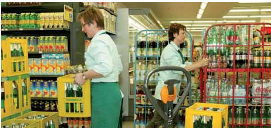
Teilzeitbeschäftigte Frauen resignieren eher als vollzeitbeschäftigte.

2005 lag der Indexwert bei rund 62 Punkten. Bei aktuelleren Erhebungen im Jahr 2008 war der Indexwert gefallen und lag nur bei 61 Punkten. Aber insbesondere seit dem Frühjahr 2009 ist ein starker Anstieg der Resignation bei den Beschäftigten bemerkbar: Der Wert lag im Frühjahr 2009 bei 63 Punkten und ist bei den aktuellen Umfragen noch um weitere zwei Punkte auf 65 angestiegen.