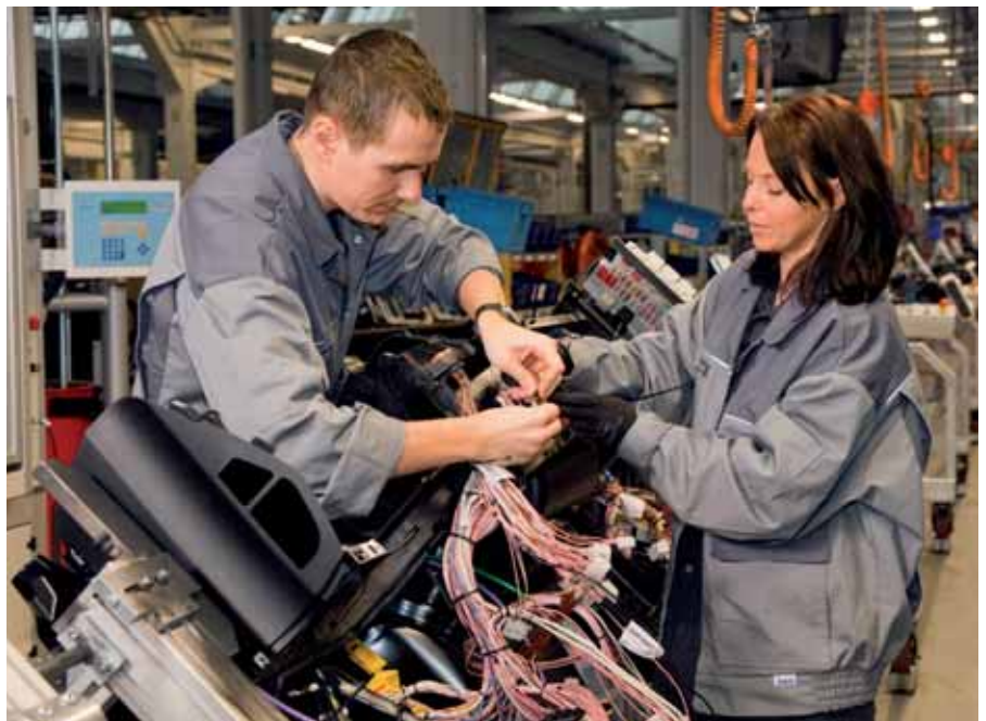
Jüngere Beschäftigte resignieren seltener als ältere.

In Kleinbetrieben finden sich mehr resignierte Arbeitnehmer/-innen, als in Großbetrieben. In Betrieben bis vier Beschäftigte beträgt der Anteil der völlig