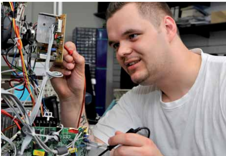
Unzufriedene Beschäftigte wechseln häufig den Job.

Resignierte Arbeitnehmer/-innen sehen vor allem auch keine Notwendigkeit mehr, ihre Situation zu verändern. Drei Viertel möchten in der aktuellen Position bleiben. Letztlich ist dies auch nicht unverständlich, da sie bereits ihre Ansprüche nach unten revidiert haben.